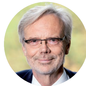
Horst Schneider Oberbürgermeister Stadt Offenbach am Main

Neue Standorte für Urbane Produktion werden in urbanen Zentren in gemischten Bauflächen und in Gewerbeparks von kleinen, wenig emittierenden Produktionsunternehmen, produktionsnahen Dienstleistern und Startups gesucht. Immobilienneu- oder -umbauten werden vorwiegend mit flexiblen Raumzuschnitten und -nutzungsmöglichkeiten errichtet. Flächeneinsparungen hingegen entstehen durch zunehmende Dienstleistungstätigkeiten innerhalb der Produktion, mobile Arbeit oder Verlagerung von Tätigkeiten ins Homeoffice. «