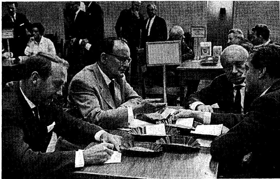
Lebendige Gespräche in der Getreide- und Produktenbörse